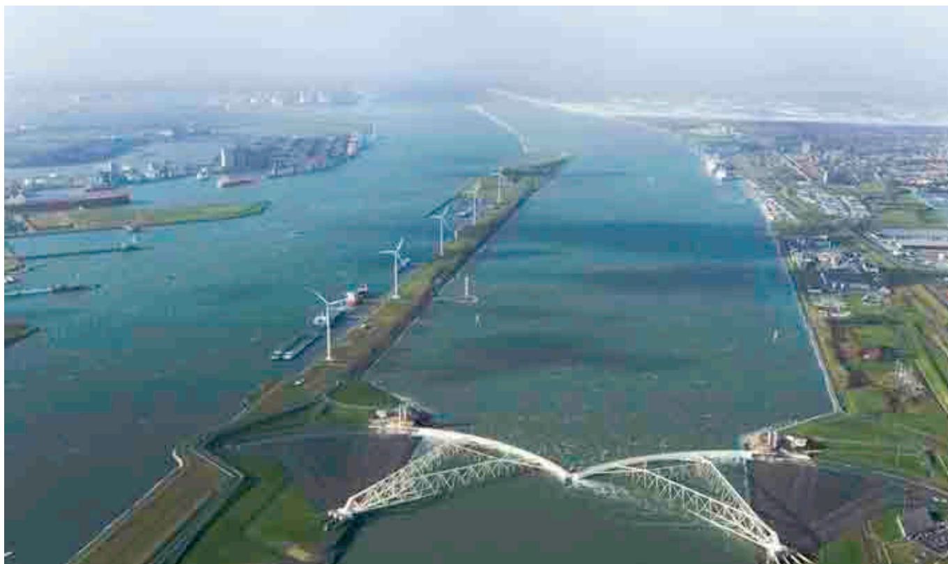
"Du kan ikke arbejde imod vand, du kan kun arbejde med det". Det siger den øverste ansvarlige for resiliens i Rotterdam. Og de ved, hvad de taler om i Holland, hvor 50 % af landets areal ligger under 1 m over havets overflade. Det vil være helt utænkeligt ikke at inddrage det i planlægning og udvikling af byerne. Her er det Maeslant barrieren uden for Rotterdam.

viser, at efter seks-syv dage uden strøm til køleskabe, madlavning og varme, og uden hjælp udefra, vil en del af befolkningen begynde at gøre oprør. Forestil dig, hvordan der opstår vold i et land fuld af våben. Nogle borgere tager selv for sig i supermarkederne, hvor der mangler basale varer, og man forsvarer sig mod hinanden og beskytter sig.